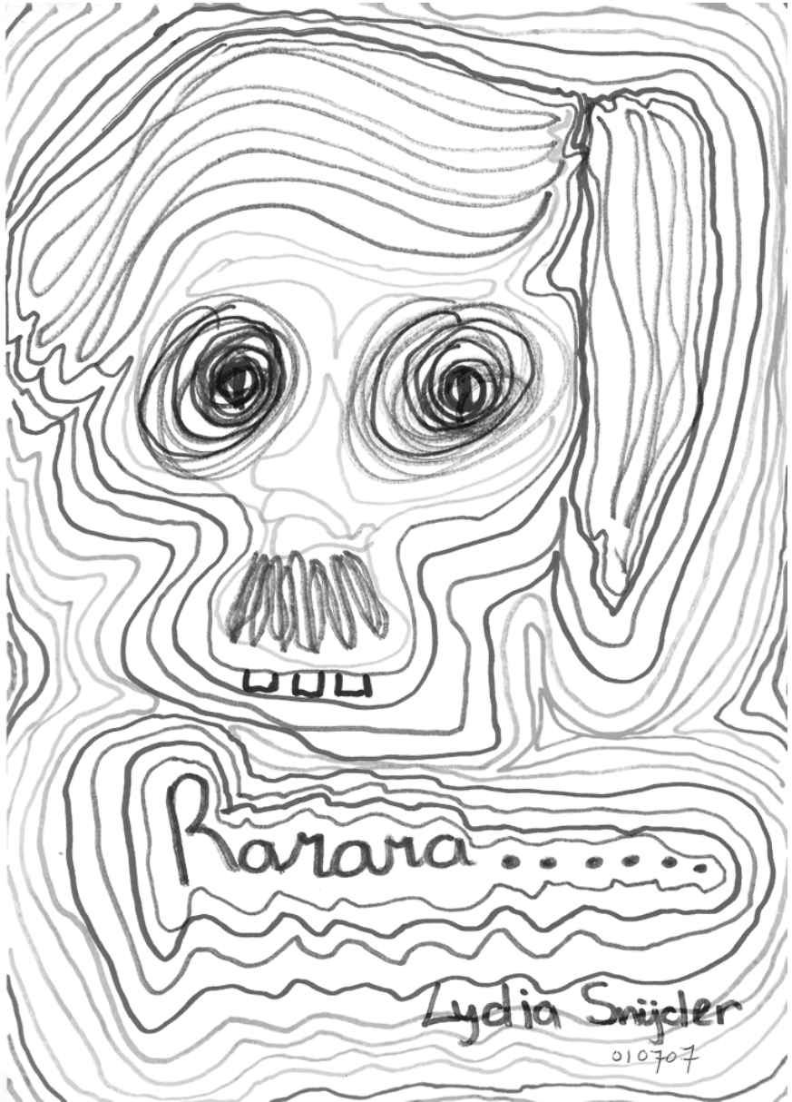
Zelfportret verandert in Hitler, getekend tijdens een opname in juli 2007